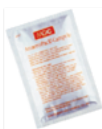
微好氧產氣包O 2 ~10~15%