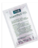
嗜二氧化碳產氣包~6%