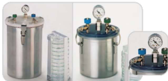
6.5 L Schuett可充氣式不銹鋼厭氧缸(10 plates)